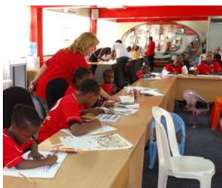
※Ұлттық конкурс (Кения)

2004 жылдан бастап компанияның қоғамды дамытуға бағытталған бастамалары аясында Toyota «Армандағы автокөлік» шығармашылық конкурсы өткізіліп келеді. Тек 2020 жылдың өзінде 75 ел мен аймақтан 1 193 000-қа жуық өтінім келіп түсті.