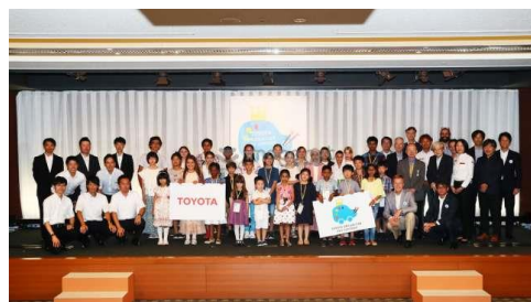
※Әлемдік конкурс қатысушыларын марапаттау рәсімі (Жапония, 2019 ж.)